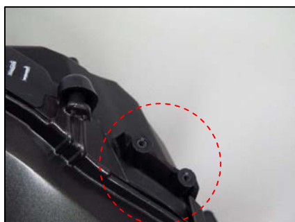
リテーナ取り付け部切断