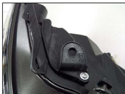
リテーナ取り付け