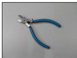
樹脂切断用ニッパー