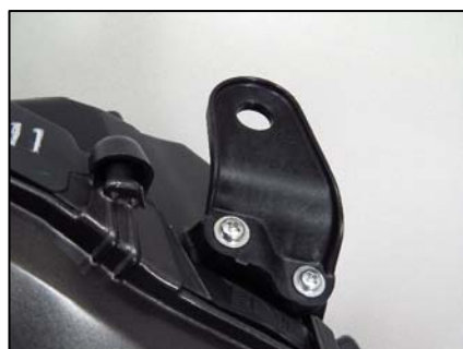
リテーナ取り付け