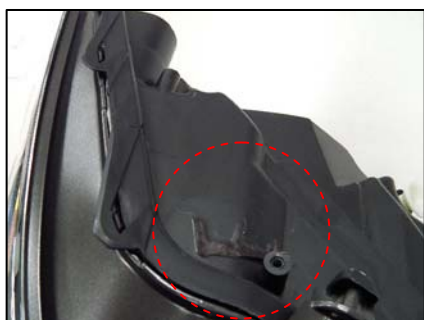
リテーナ取り付け部切断